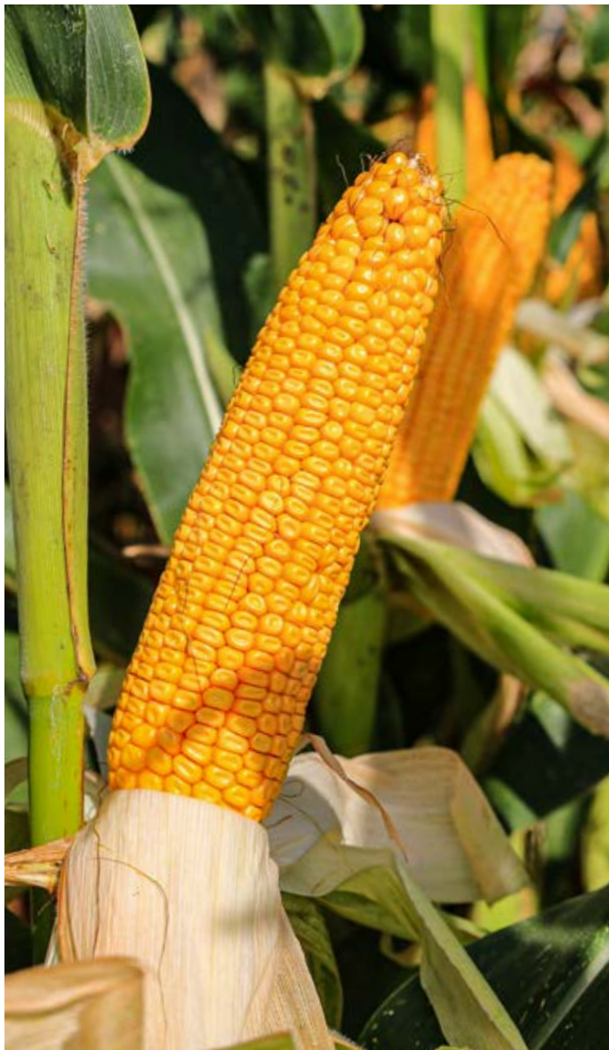
KUKUŘICE SETÁ, FAO S 190